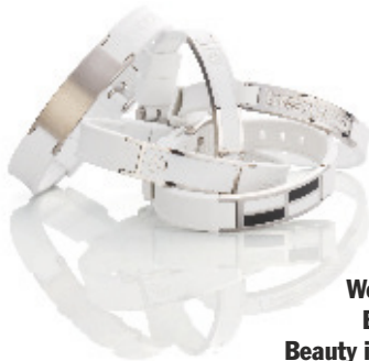
Wohlfühl- Bänder: Beauty in white