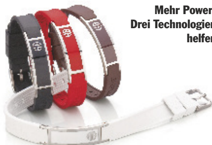
Mehr Power: Drei Technologien helfen

! Es gibt mittlerweile tausende wissenschaftliche Veröffentlichungen weltweit, die die Wirksamkeit von „negativen Ionen“, Ferninfrarot Strahlung (Wärme Strahlung) und Magnetfeldtherapie bestätigen.